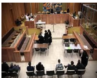
Participation aux audiences du tribunal judiciaire