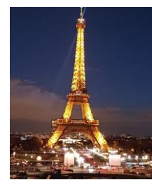
Journée à Paris, visite d'entreprises...