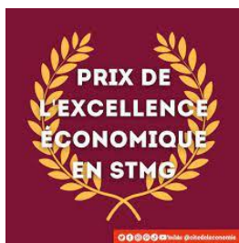
Participation au prix de l'excellence économique