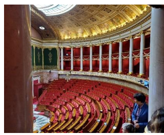
Visite de l'Assemblée nationale avec notre députée